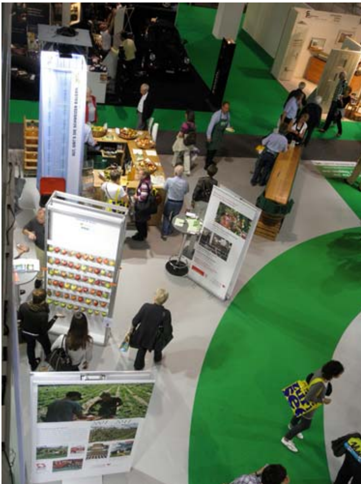
Zueri-Obst an der Züspa: Obst- und Süssmostverkauf kombiniert mit Wettbewerben und Sortenschau