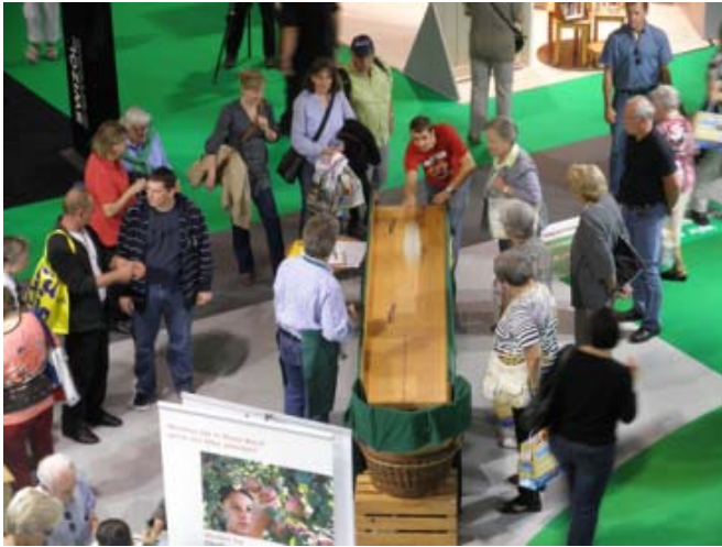
Das Mostkrugschieben faszinierte auch in diesem Jahr alle Besucherschichten