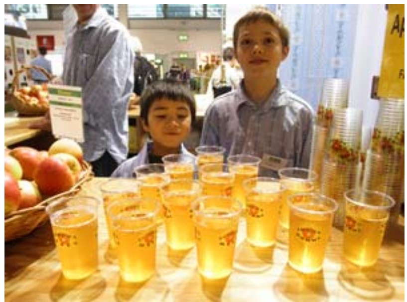
Viele grosse und kleine Helfer waren im Einsatz am Obststand