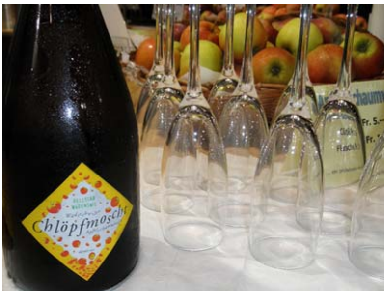
Zum Apéro ein Apfel-Cüpli hat vielen BesucherInnen gemundet